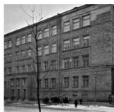
1936 год – строительство здания школы №32

Михаил Васильевич проживал в доме Бона с 1741 по 1757 годы. Теперь на этом месте стоит здание гимназии №32