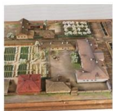
Бонов дом и химическая лаборатория М. В. Ломоносова

Михаил Васильевич проживал в доме Бона с 1741 по 1757 годы. Теперь на этом месте стоит здание гимназии №32