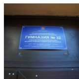
1997 году – школа получила статус гимназии

До 1965 года в школе было восьмилетнее обучение (неполное среднее), после ввели десятилетнее (полное среднее).